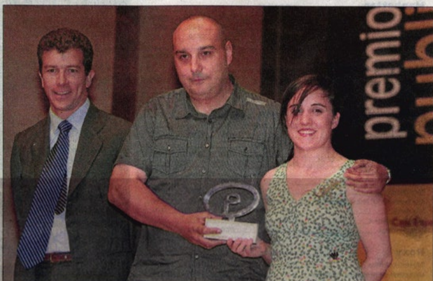
Los ganadores del premio a la mejor campaña, con su galardón.