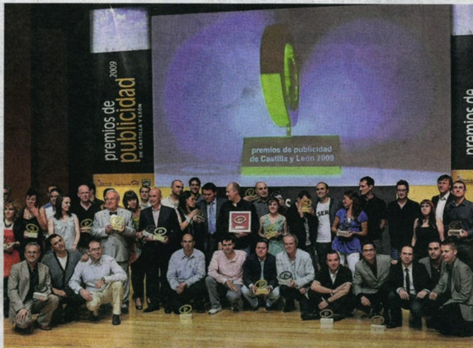
Los premiados posan en el escenario del auditorio Miguel Delibes.