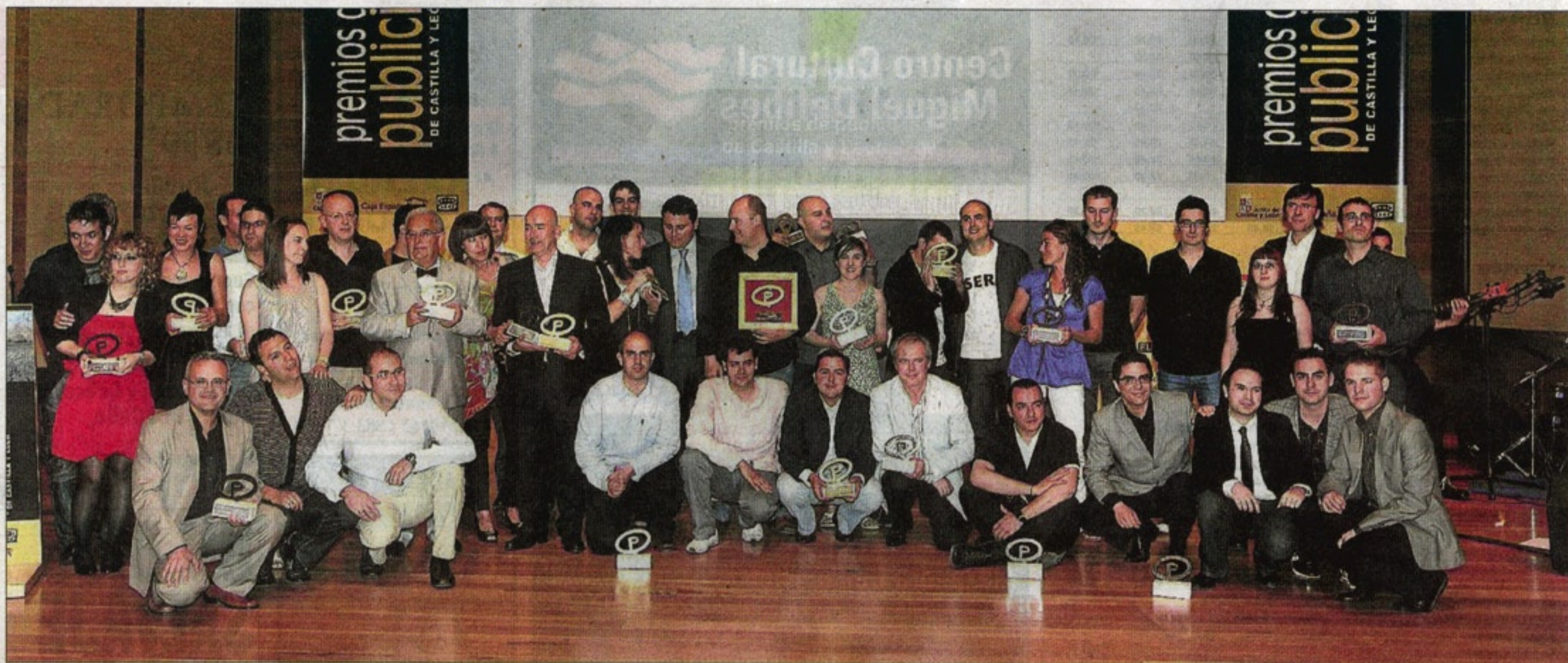
Foto de familia de los premiados durante la gala celebrada anoche en el Centro Cultural Miguel Delibes de Valladolid.